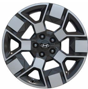
19" kola z lehké slitiny