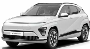
Serenity White Perleťová Kombinace s černým lakováním střechy Cena: 17 900 Kč