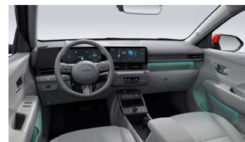
Šedý interiér – čalounění sedadel kůže – výhradně pro Style Premium