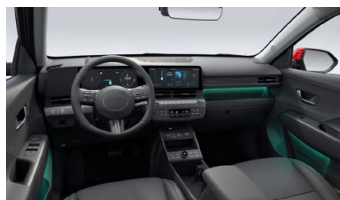
Černý interiér – čalounění sedadel kůže – výhradně pro Style Premium