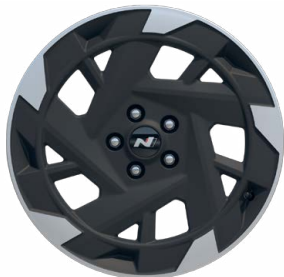
19" kola z lehké slitiny N Line