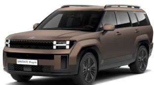
Earthy Brass Matt Matná Cena: 34 900 Kč