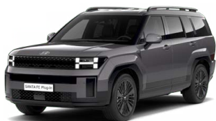
Magnetic Gray Metalická Cena: 19 900 Kč