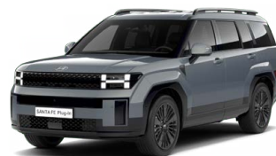
Pebble Blue Perleťová Cena: 24 900 Kč