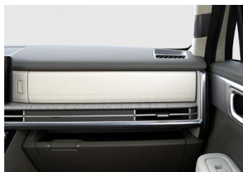
Tmavě zelený Forest Green interiér - krémové čalounění sedadel - světlé čalounění stropu - světlé provedení bočních sloupků - tmavě zelené provedení výplní dveří