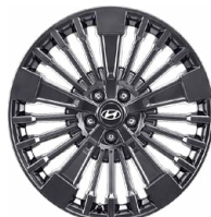
Calligraphy 20" kola z lehké slitiny