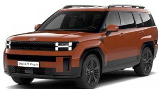
Terracota Orange Pastelová Cena: 0 Kč