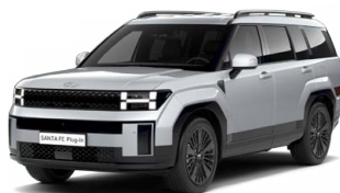
Typhoon Silver Metalická Cena: 19 900 Kč