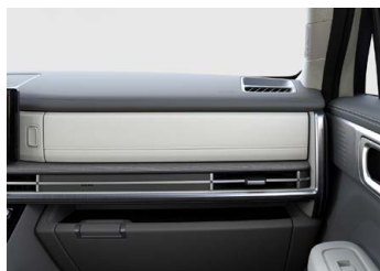
Šedý Supersonic Gray interiér - šedé čalounění sedadel - světlé čalounění stropu - světlé provedení bočních sloupků - šedé provedení výplní dveří