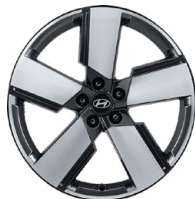
20" kola z lehké slitiny