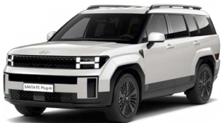
Creamy White Perleťová Cena: 24 900 Kč