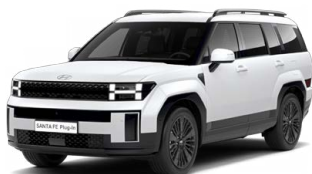
Creamy White Matná Cena: 34 900 Kč