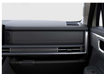
Černý Obsidian Black interiér - černé čalounění sedadel - světlé čalounění stropu - světlé provedení bočních sloupků - černé provedení výplní dveří