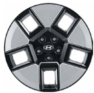
18" kola z lehké slitiny