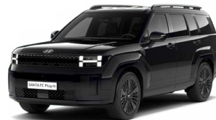
Abyss Black Perleťová Cena: 24 900 Kč