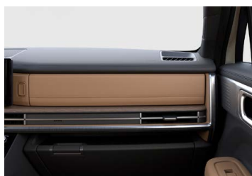
Hnědý Pecan Brown interiér - hnědé čalounění sedadel - černé čalounění stropu - černé provedení bočních sloupků - hnědo-černé provedení výplní dveří