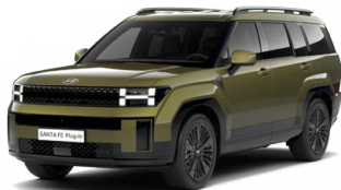
Ocado Green Perleťová Cena: 24 900 Kč