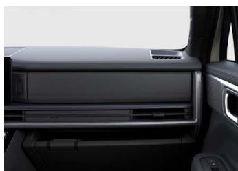
Prémiový černý Calligraphy interiér - černé čalounění sedadel z prémiové Nappa kůže - černé čalounění stropu - černé provedení bočních sloupků - černé provedení výplní dveří